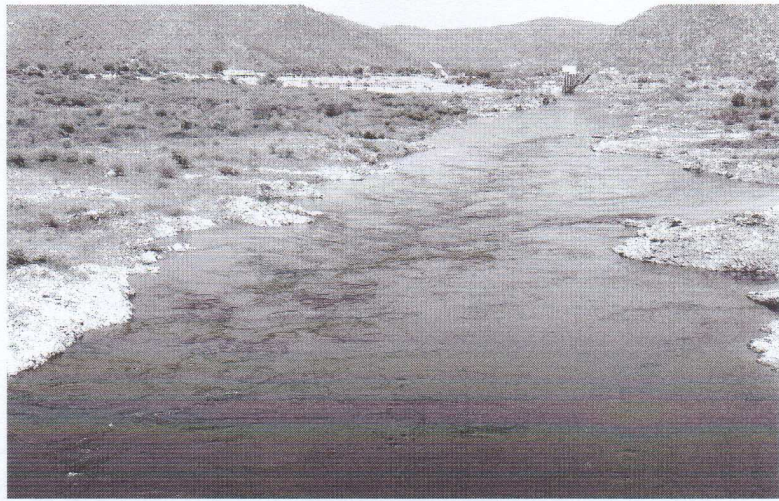
Comitê da Bacia Hidrográfica do Rio São Francisco diz que vazão atual já é a menor da história do manancial e vai causar impactos profundos

Para a CBHSF, é evidente que essa medida vai causar impactos profundos. "A navegação praticamente acabou em diversos pontos aqui no Baixo São Francisco após a redução. A piracema, que acontece em janeiro, deverá enfrentar profundas dificuldades. Alguns municípios praticamente não praticam algumas culturas, como a rizicultura, justamente devido a pouca água", informou o comitê.